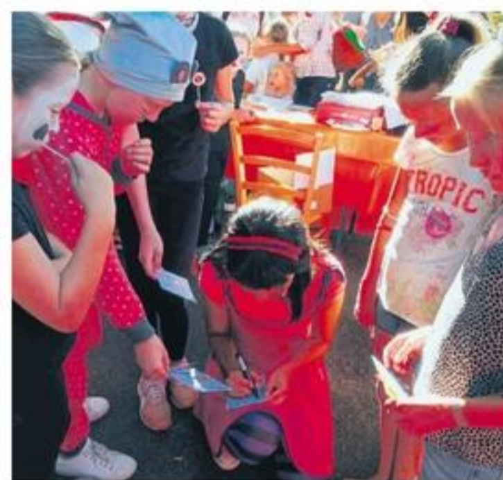
Die Autogramme nach der Premiere waren heiß begehrt.

Einen Vorgeschmack gibt es im Internet auf der Homepage des Kreisbotes Kempten unter www.kreisbote.de/fotostrecken/ suk