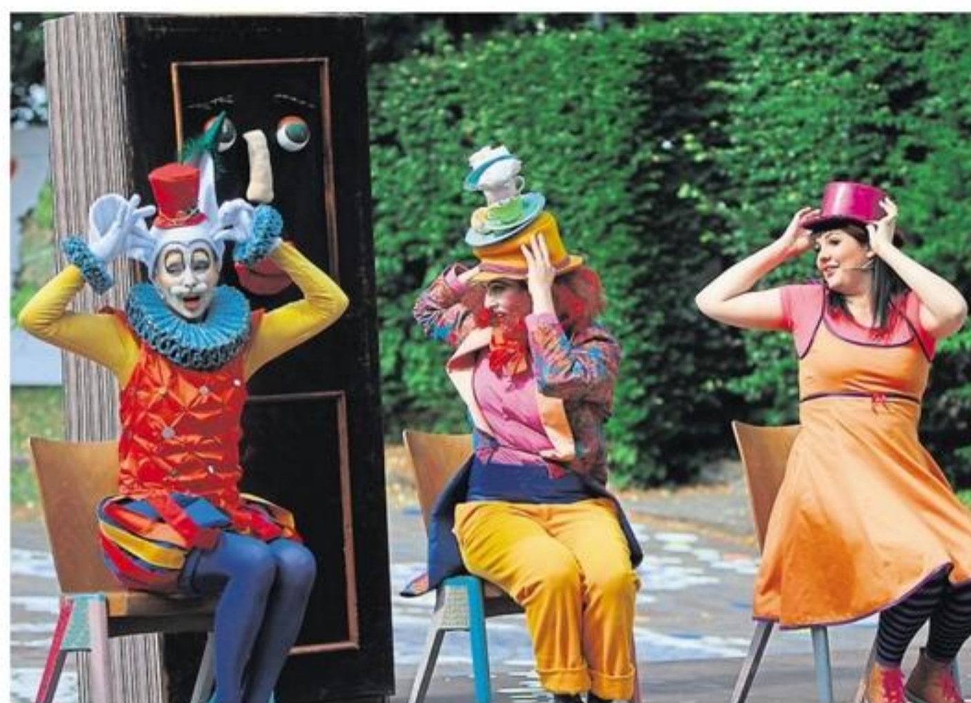
Tea-Time mit Hase (l.) und Alice (r.): Der verrückte Hutmacher lädt jeden Tag zur Geburtstagsfeier ein, um nicht mit der Herzkönigin Croquet spielen zu müssen.